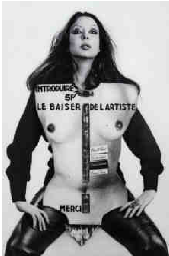
ORLAN, Le Baiser de l'artiste, Le Distributeur automatique ou presque! 1977, action ORLAN-CORPS, Georges Meguerditchian, Coll. Centre Pompidou

Pour la FIAC de 1977, ORLAN réalise « Le Baiser de l'artiste », performance célèbre qui s'accompagne d'interpellations vives: « approcher, approchez, hurle l'artiste, venez sur mon piédestal, celui des mythes: la mère, la pute, l'artiste ». Deux stéréotypes, « la mère », « la pute », toujours omniprésents dans notre société. Sur ce piédestal étaient disposés une photographie grandeur nature d'ORLAN travestie en Madone, un bouquet de lys blancs aux pieds, des cierges, puis à leur gauche, le torse photographié de l'artiste, sorte de parcmètre ou distributeur de baisers à 5f pièce. Située entre les deux seins, la fente par laquelle on introduisait la pièce de monnaie venait se lover dans le vagin, cavité transparente. Le public est amené à choisir entre déposer 5f aux cierges assignés à Sainte ORLAN et/ou l'octroie d'un baiser de l'artiste, plus précisément un « french kiss ».