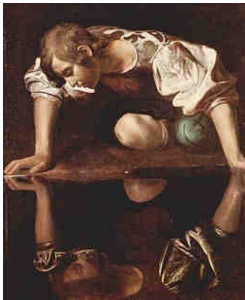
Narcisse, par Le Caravage (v. 1595)