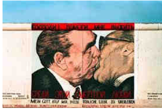
Graffiti sur le mur de Berlin

L'amour ne sera plus le commerce de deux êtres, mais celui d'une humanité avec une autre. Il sera infiniment délicat et plein d'égard, bon et clair dans toutes les choses qu'il noue ou dénoue. Il sera cet amour que nous préparons, en luttant durement : deux solitudes se protégeant, se complétant, se limitant, et s'inclinant l'une devant l'autre.