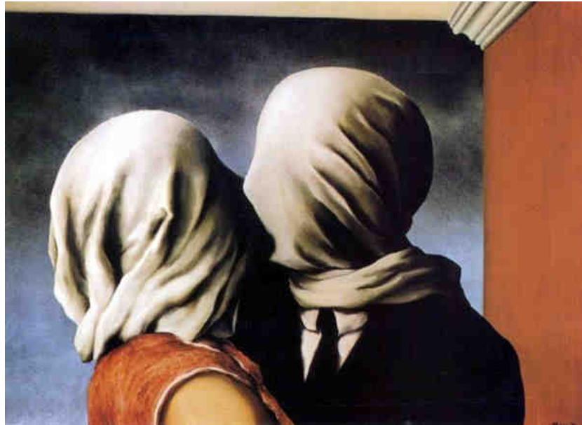
Magritte "Les amants", 1928