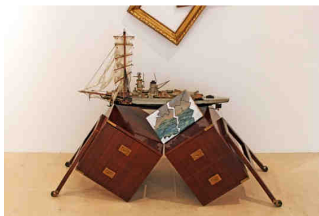
Jacques Lizène - Naufrage de regard

Ce dispositif se monte en une heure et se démonte en 30 minutes.