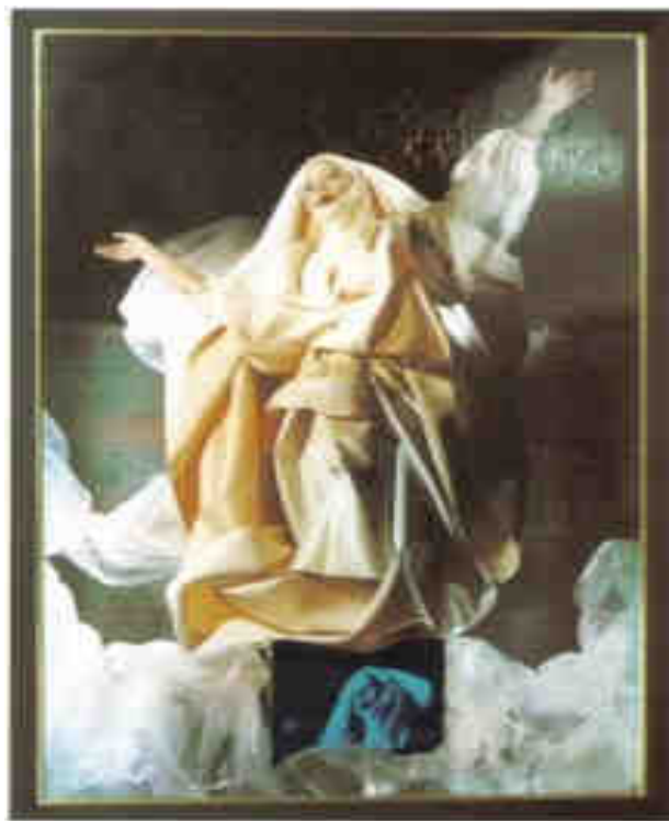
ORLAN, Vierge Blanche au nuage de plastique Bulle, 1984, donation Camille, Coll. Centre Pompidou