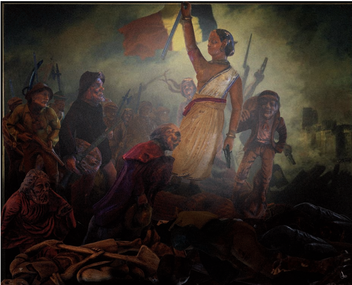
La Liberté guidant le peuple d'Eugène Delacroix (1830)

NB : vous pouvez retrouver l'ensemble de ces visuels sur notre site internet