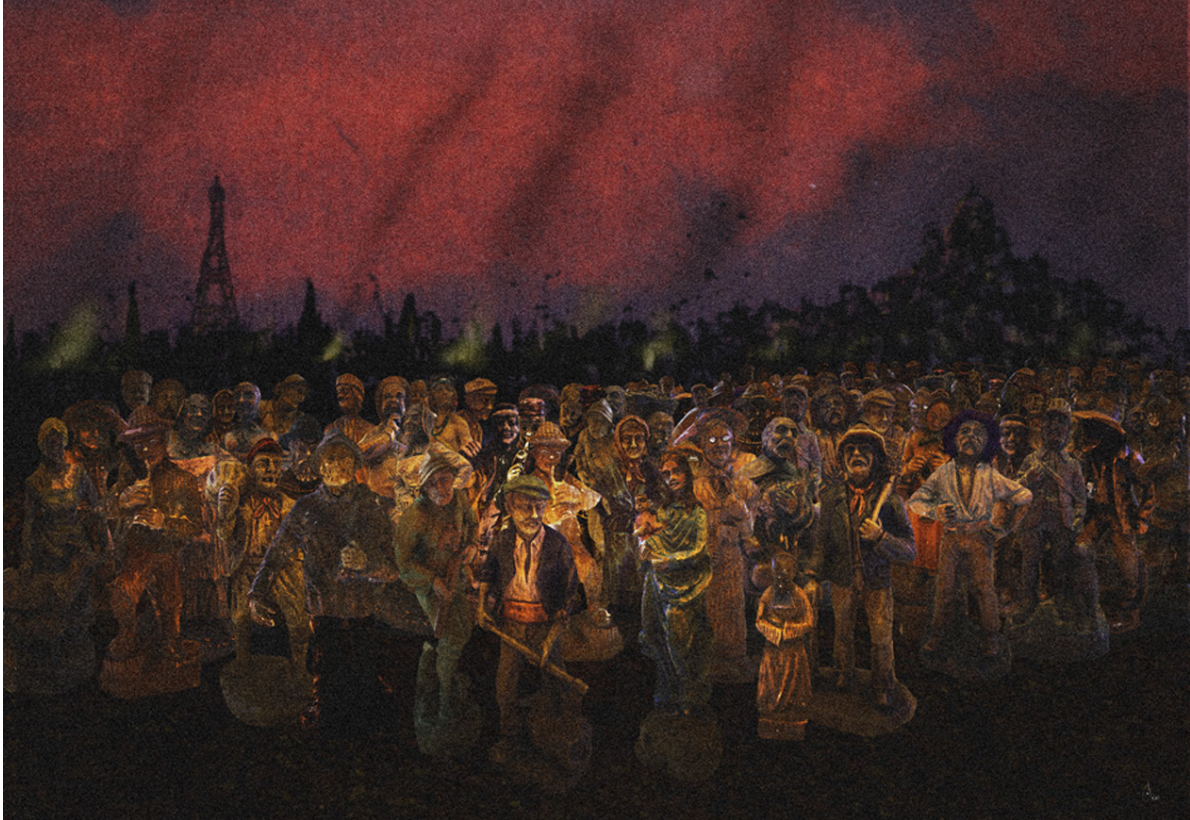
Il Quarto Stato de Giuseppe Pellizza (1901)

... et puis en parallèle avec les autres visuels du spectacle. Demandez leur de retrouver le nom des célèbres tableaux qui ont inspiré ces illustrations.